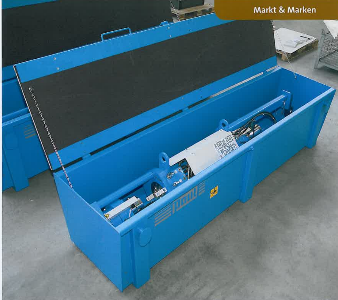
Kleines Gerät, große Wirkung: Mit Litzenhebern werden weltweit allerschwerste Lasten bewegt.

Die Steuerung überwacht den Hebe- oder Absenkbetrieb. Es kann zwischen Druck- und Wegüberwachung gewählt werden. Bei Überschreiten der vorgegebenen Grenzwerte wird der Bediener gewarnt und bei