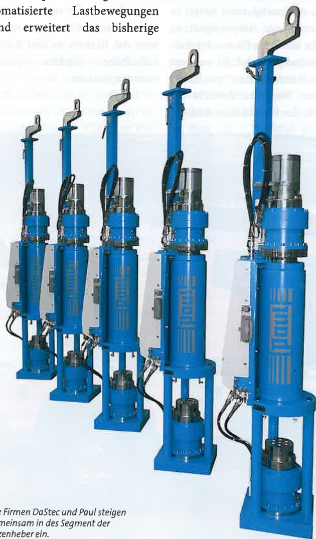
Die Firmen DaSTec und Paul steigen gemeinsam in des Segment der Litzenheber ein.