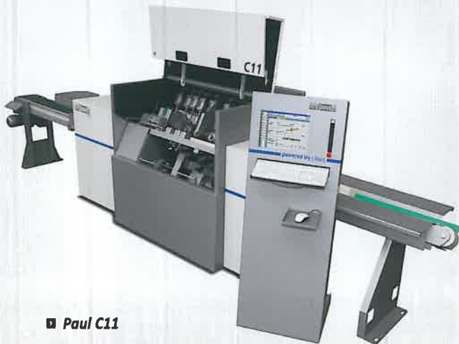
■ Paul C11

■ Weitere Infos finden Sie im Internet unter www.paul.eu