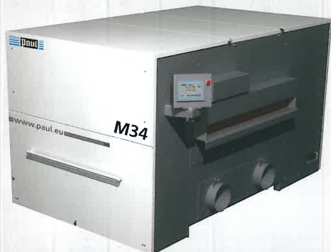
▶ Neue Mehrblattkreissäge M34G von Paul

Die Paul Maschinenfabrik, Spezialist für Platten- und Massivholzbearbeitung, Optimierungskappen sowie für intelligente Mechanisierungslösungen, präsentiert bei der LIGNA vom 22. bis 26. Mai in Hannover, zukunftsichere Technologien der Kreissägen-Technik. Profitieren Sie von höchster Anlagenverfügbarkeit, jeder Menge Know-how und einem schnellen, unkomplizierten Service. Diese Qualitäten machen den oberschwäbischen Maschinenbauer seit über 70 Jahren zu einem Marktführer der industriellen Holzverarbeitung. Überzeugen Sie sich selbst, auf dem knapp 450 m 2 großen Stand (Halle 27, Stand B50), vom Produktportfolio beider Marken, Reinhardt und Paul. Dabei steht neben zahlreichen Neuheiten und Verbesserungen auch Altbewährtes im Fokus.