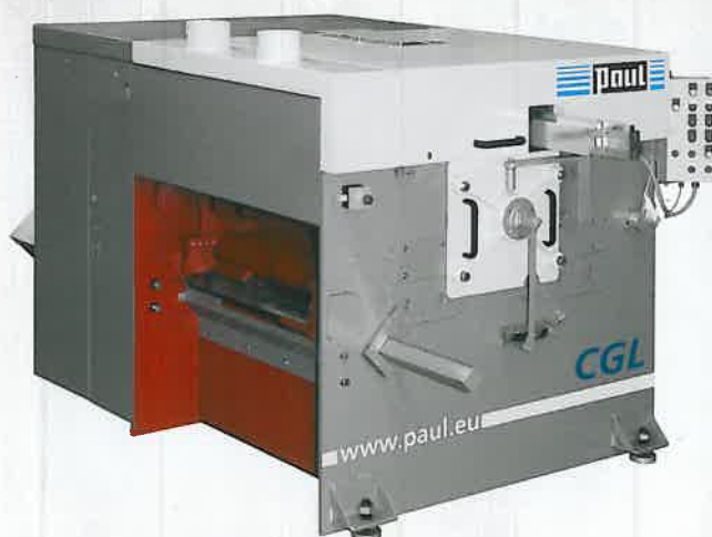
▶ Neue, flexible Auftrennkreissäge CGL von Paul