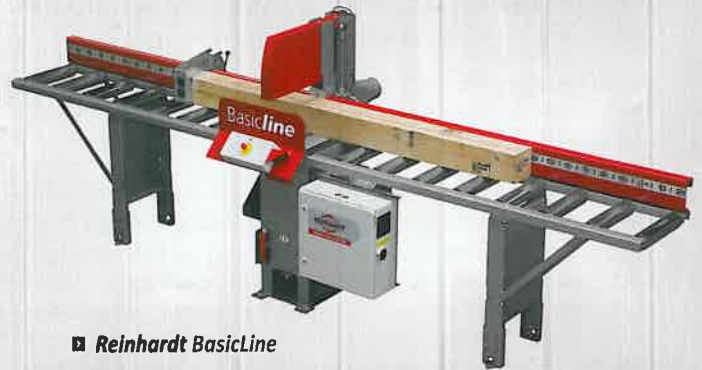
■ Reinhardt BasicLine